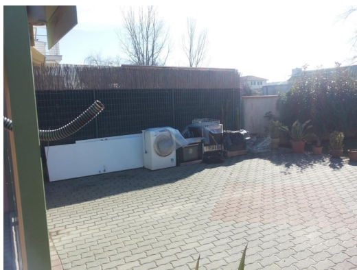
Elettrodomestici accatastati ancora dopo mesi