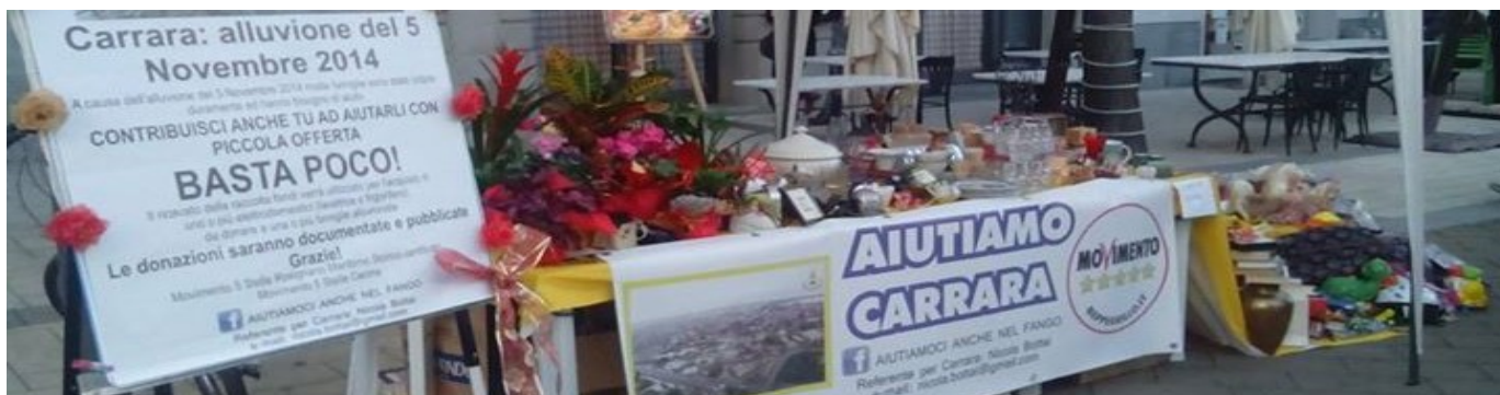
Un momento del mercatino di solidarietà a Cecina e sotto il livello dell'acqua raggiunto nelle case

Sono stati consegnati il 2 febbraio u.s. i soldi raccolti dal mercatino di solidarietà a Cecina e dai “bussoli” di raccolta fondi distribuiti in alcuni esercizi commerciali