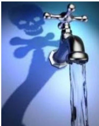
Tubature in cemento-amianto, pericolose.

di Cecina è il peggiore con il 37,14% di tubazioni in cemento amianto, seguito dal comune di Livorno con il 35%, da